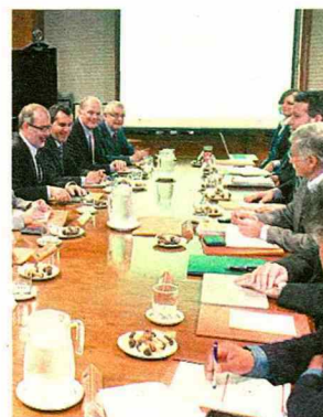
■ Tras la junta de accionistas de Codelco , el ministro de Hacienda, Rodrigo Valdés, valoró la contención de costos de la cuprera estatal.

supuestos técnicos y estado de avance. "Básicamente respecto de sensibilización de la situación de la compañía relativo a precios internacionales de largo plazo y de proyectos específicos y los cambios técnicos que se han hecho. Es razonable que tengan preguntas y enviaremos a la brevedad los antecedentes", aclaró.